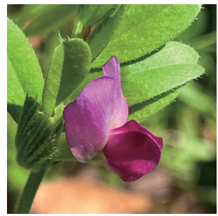
春色の立教通りーカラスノエンドウ