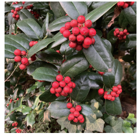
'Tis the Season to Be Jolly