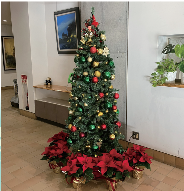
学校玄関のクリスマス・ツリー