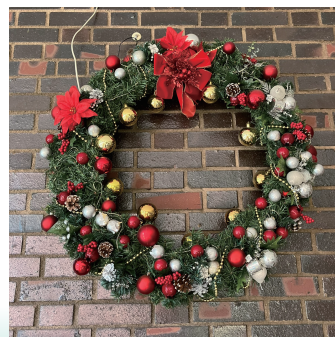
クリスマス・リース